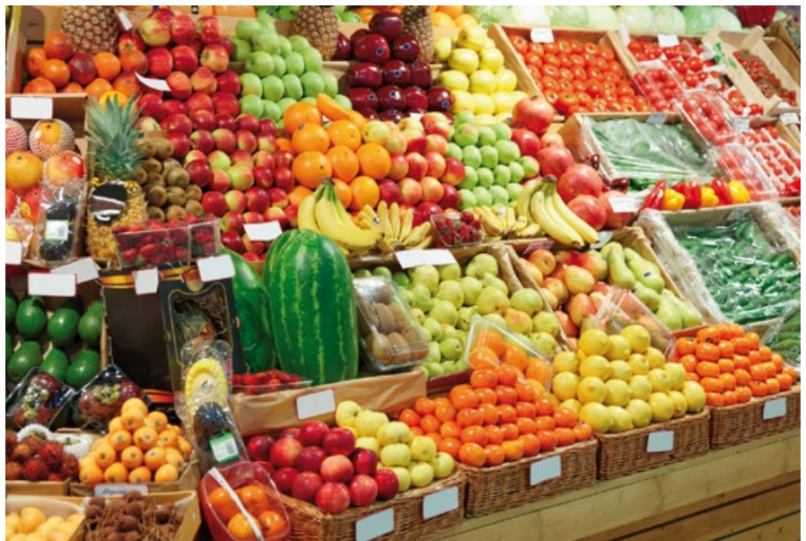
FIG. 1 GESTIONE RIFIUTI E SPRECO ALIMENTARE

In Italia, il Programma nazionale di prevenzione dei rifiuti , adottato con decreto direttoriale del 7 ottobre 2013, individua i rifiuti biodegradabili tra i flussi prioritari di intervento e identifica un set di misure specifiche finalizzate in primo luogo alla riduzione degli sprechi alimentari. Ulteriori e più specifiche misure sono state identificate nell'ambito dei lavori del Piano nazionale di prevenzione degli sprechi alimentari (Pinpas) e in particolare nel Position paper sulla donazione degli alimenti invenduti (Azzurro P., 2015) e nel documento sulle azioni prioritarie per la lotta allo spreco (Segrè A., Azzurro