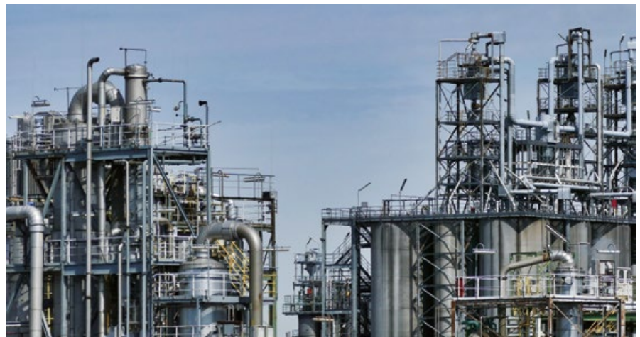
TAB. 2 SAD 2018

Tavola riassuntiva dei sussidi illustrati nella terza edizione del Catalogo riportati per macrocategoria e per qualifica del sussidio.