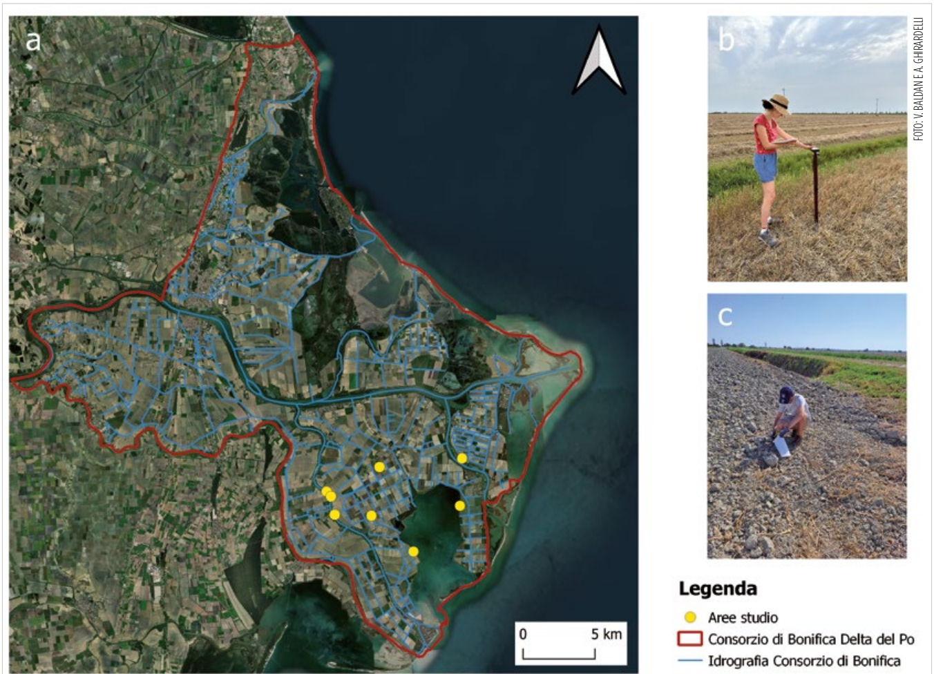
FIG. 1 MONITORAGGIO IMPATTO SALINIZZAZIONE (a) Posizione geografica dei siti di campionamento all'interno del territorio del Consorzio di bonifica Delta del Po. (b) (c) Campagna di rilievi dell'estate 2023.

Le colture primaverili-estive, il cui apice vegetativo coincide generalmente con l'avanzata del cuneo salino, sono le più esposte alle problematiche di salinità e di carenza di acqua irrigua. Ciò ha almeno in parte influito sulle scelte colturali delle aziende del Consorzio, che dal 2015 hanno visto un incremento delle superfici a grano, la coltura autunno-vernina più diffusa nel comprensorio e una netta riduzione delle superfici a riso, una coltura estiva distintiva della zona ma con un fabbisogno idrico estremamente