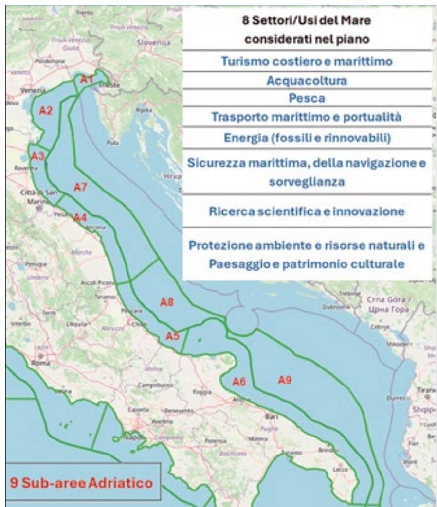
FIG. 1 SUB-AREE ADRIATICO

multi-scalare [1] e tenendo conto delle previsioni delle singole politiche, norme e piani di settore e delle interazioni "terra-mare". In fase di elaborazione dei piani, i tre bacini sono stati suddivisi in sub-aree; sono stati individuati obiettivi specifici coerenti con gli obiettivi strategici assegnati alle aree marittime; sono state delimitate le unità di pianificazione a cui sono state attribuite specifiche vocazioni d'uso; infine sono stati definiti un set di misure e di indirizzi.