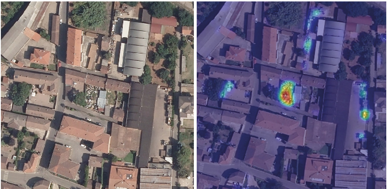
FIG. 1 PROGETTO SAVAGER

Si pone la questione se il reato di violazione delle prescrizioni sia configurabile qualora il superamento dei limiti delle emissioni emerga in sede di autocontrollo e venga a conoscenza dell'amministrazione a seguito della