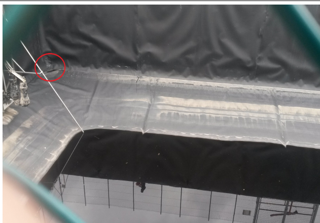
Foto 5: Vasca 1 con indicata la zona in cui si sarebbe lesionato il telo