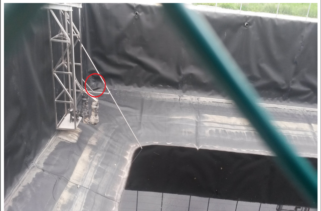
Foto 4: Vasca 1 con indicata la zona in cui si sarebbe lesionato il telo