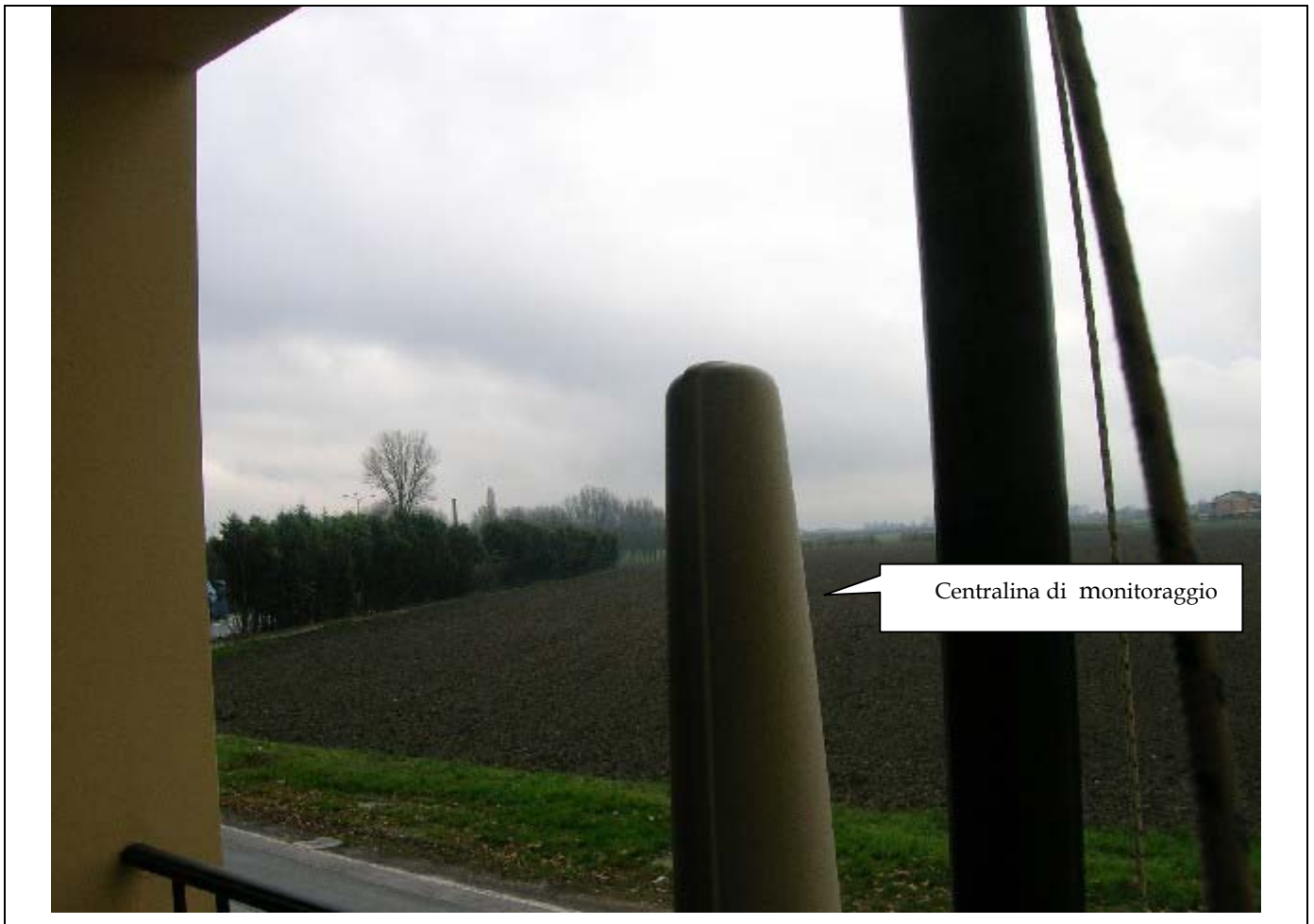
Centralina di monitoraggio