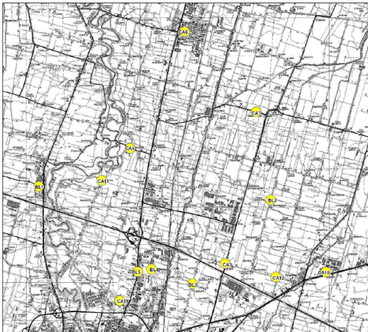
Figura 1 - Ubicazione di massima stazioni di rilevamento della biodiversità lichenica

Si riportano di seguito per la campagna 2019 le mappe di ubicazione di massima delle stazioni di rilevamento della biodiversità lichenica (Figura 1) e dei punti per analisi del bioaccumulo sui licheni (Figura 2).