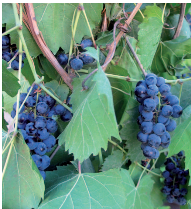
Foto 20: Grappolo di Vitis vinifera sylvestris fotografato in un torrente di Villacidro in Sardegna