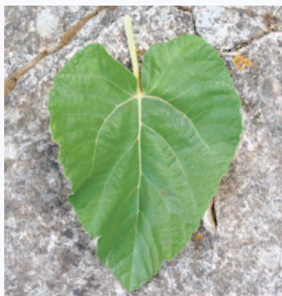
Particolari morfologici della foglia del Fico Ficattala