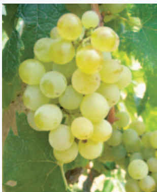
Uva degli Sciali, reperto fotografato negli arenili di Vieste (N. Biscotti)