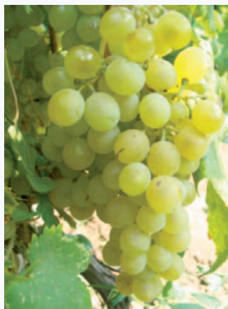
Uva degli Sciali, reperto fotografato negli arenili di Peschici

Nello Biscotti, agronomo, Vico del Gargano (FG), nellobiscotti@fastwebnet.it