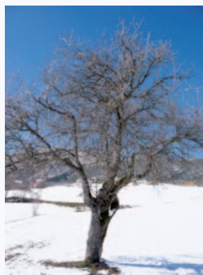
Questo pero è il patriarca di Bobbio (S. Guidi)

Questo frutto tradizionale delle colline bolognesi non si trova in altre province dell'Emilia Romagna e i pochi alberi che si conoscono sono tutti secolari con dimensioni enormi.