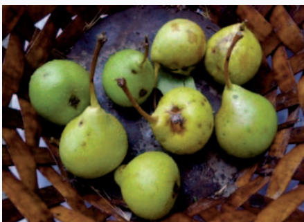
Pere Zucche a completa maturazione (S. Guidi)