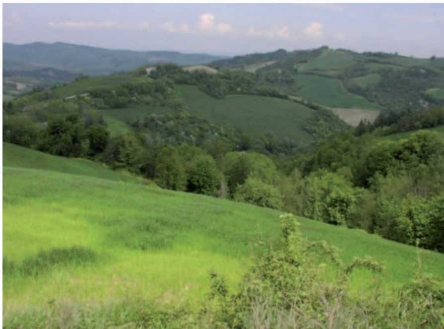
Foto 21: Il paesaggio agrario tradizionale delle colline romagnole (S. Guidi)

La regione Emilia-Romagna ha una grande tradizione agricola e nel settore ortofrutticolo è fra le prime in Europa, non solo sotto l'aspetto produttivo ma anche per la ricerca e il miglioramento genetico. Ciò è stato probabilmente possibile grazie a condizioni pedoclimatiche favorevoli, ma anche per la grande tradizione rurale e la presenza di coltivazioni frutticole che risalgono al passato. Non è un caso che qui si ritrovino i grandi patriarchi fruttiferi che potrebbero aver fornito o potrebbero fornire in futuro il corredo genetico per migliorare le moderne cultivar. La selezione delle nuove varietà fruttifere ha quindi potuto operare su una base genetica molto ampia, utilizzando materiale che negli anni si è adattato all'ambiente e quindi si è mostrato anche più resistente alle avversità. Inoltre occorre ricordare che la prima mostra nazionale dedicata alla frutta si svolse proprio in Emilia-Romagna, a Massalombarda, negli anni successivi alla Prima Guerra Mondiale. Questa cittadina romagnola, in provincia di Ravenna, era considerata la capitale della frutta, in particolare della pesca, sia per la presenza di grandi coltivazioni frutticole sia per le industrie di lavorazione e trasformazione di tali prodotti. Qui è nato un famoso marchio simbolo dei succhi di frutta. Che l'Emilia-Romagna fosse