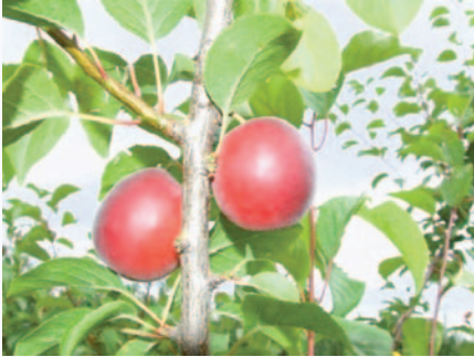
Frutti di Biricoccolo a luglio (D. Ghetti)