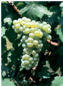
Uva Verdetto pronta per la vendemmia (S. Romani)