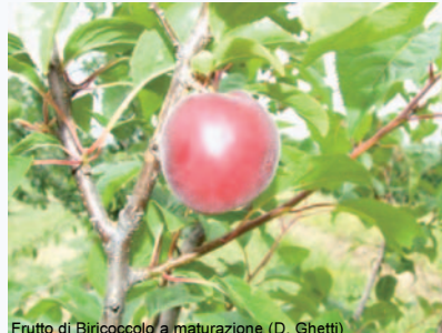
Frutto di Biricoccolo a maturazione (D. Ghetti)