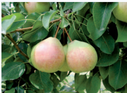
Frutti ormai maturi, prossimi alla raccolta (V. Ancarani)