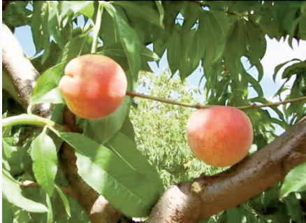
Pesca Bella di Cesena a maturazione (S. Guidi)