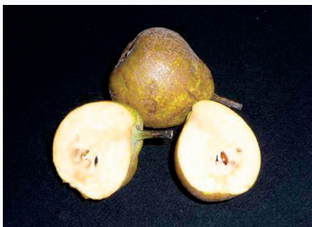
Frutti sezionati di Pero Nigrèr (S. Guidi)