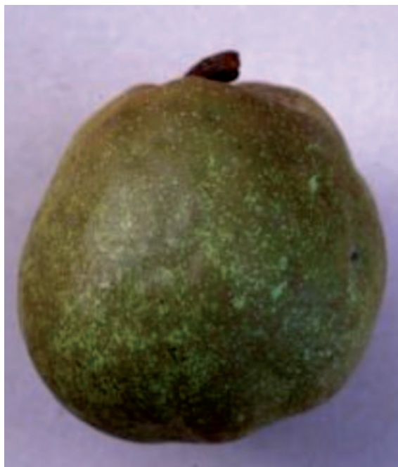
Foto 12: Particolari pomologici della pera invernale Trentatrè Once

Referente: Marco di Santo marco.disanto@parcomajella.it