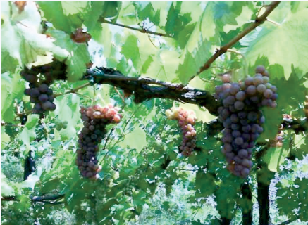
Grappoli di Uva Morta prossimi a maturazione