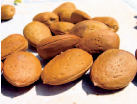
Mandorle di Prunus webbii Spach. (N. Biscotti)