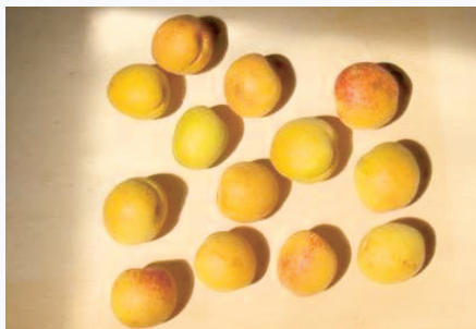
Frutti di albicocca Tonda di Tossignano (D. Ghetti)