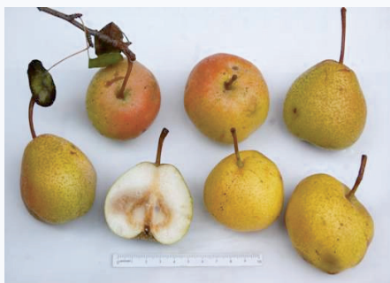
Frutti maturi di Pera delle Garapine (A. Montecchi)