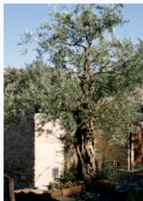
Olivo della Cortigiana di Castrocaro (A. Gulminelli)

Nel XV e XVI sec. l'olivicultura era diffusa nel castrocarese. L'analisi del DNA fogliare non ha evidenziato nessun livello di similarità con altre cultivar catalogate e descritte in Emilia Romagna.