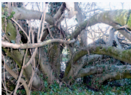
Ceppaia dell'enorme Fico di Cavana

Questa straordinaria pianta meriterebbe di essere studiata sia per conoscerne la varietà, sia per la sua capacità di vegetare praticamente nell'acqua, superando i problemi di asfissia.