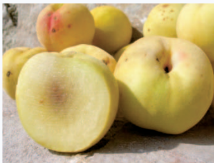
Sezione longitudinale che evidenzia grana e colorazione della polpa (N. Biscotti).

Tradizione orale. In letteratura storica, si parla di due varietà tipiche della Puglia: Percoca bianca di luglio, Percoca striata di settembre (Pantanelli, 1934), entrambe diverse dal tipo in esame. Nessuna attenzione di tutela.