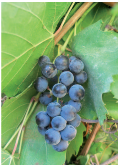
Foto 19: Grappoli con foglie del vitigno Corinto in rinvenuto a Belpasso (CT) (S. Guidi)

affinità genetica per cui è facile dedurre che i vitigni sardi sono il risultato dell'addomesticamento di quelli selvatici. E' dunque una prima testimonianza di nuovi centri d'origine della vite coltivata, aprendo nuovi capitoli a quella consolidata verità storica che lega il processo di addomesticazione della vite alla Mezzaluna fertile. Referente: Nello Biscotti (nellobiscotti@fastwebnet.it)