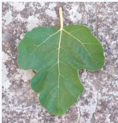
Particolare della foglia del fico Ricotta (P. Belloni)

Paolo Belloni, Associazione La Pomona onlus pomona@tin.it Cisternino (BR).