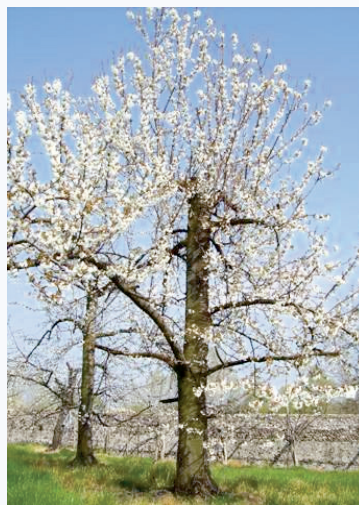
Ciliegio Morettina di Vignola in fioritura (S. Guidi)

Consorzio della Ciliegia di Vignola, Dir. Walter Monari (consorziodellaciliegia@tin.it)