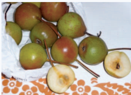
Pere Rusèt a maturazione completa (S. Guidi)