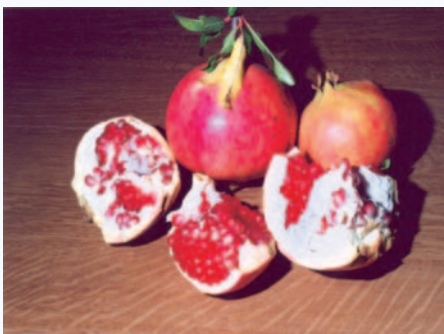
Melograno Grossa di Faenza coi grandi chicchi (S. Guidi)

In Romagna il melograno era quasi sempre presente nelle aziende agricole e veniva di solito piantato vicino alle case. Oltre al valore simbolico (rappresenta la fertilità), il frutto del melograno era spesso utilizzato al posto del limone nelle insalate e sulle carni. Anche l'Artusi consigliava in cucina il melograno e alcune sue ricette ne fanno riferimento come i "cefali in gratella al melograno".