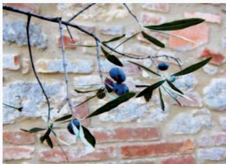
Frutti dell'Olivo Cortigiana (E. Caruso)