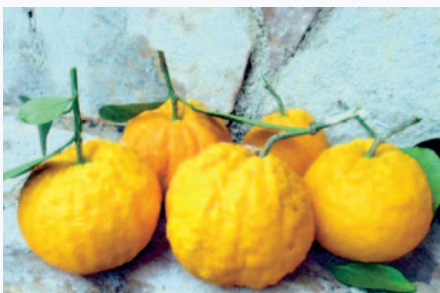
Campioni di Arancia Incannellata nel mese di gennaio (N. Biscotti)

Citrus sinensis (L.) Osbeck f. caniculata