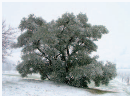
Olivo di Tabiano nel periodo invernale

In antichi testi è segnalata la coltivazione dell'olivo in questa località e nella bassa collina parmense fin dal 1258. La tradizione popolare del luogo vuole che questa pianta vegeti da una antica ceppaia probabilmente risalente a quell'epoca.