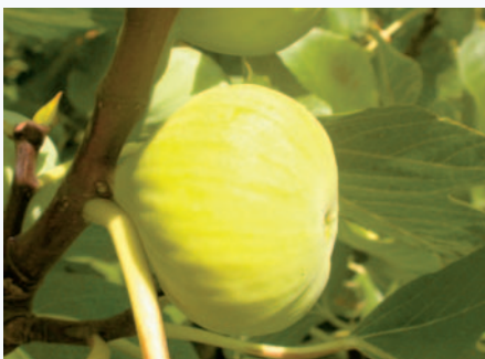
Il Fico Abate in fruttificazione (F. Minonne)