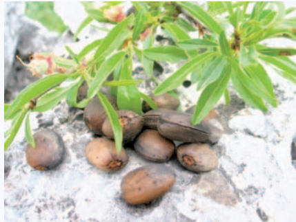
Particolari di foglie, frutticini e frutti stramaturi di Prunus webbi Spach.