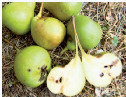
Frutti con polpa succosa (A. Santini)

Questo frutto unico per il territorio del Montefeltro, veniva in passato coltivato per l'autoconsumo e destinato alla produzione di ottime marmellate che si consumavano durante tutto l'inverno. I peri erano spesso piantati lungo i filari come tutori vivi delle viti, oppure isolati in mezzo ai campi dove avevano anche la funzione di offrire l'ombra sotto la quale riposare o consumare il pranzo durante i lavori estivi.