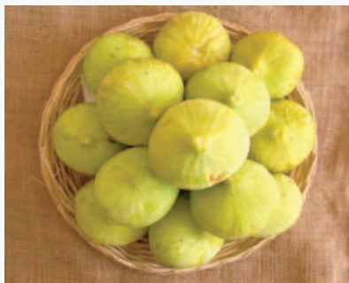
Particolari pomologici del Fico Abate (F. Minonne)

La varietà è ben descritta nella bibliografia di riferimento, in particolare Vallese (1909) ne fa ampia trattazione nella sua opera principale. Rilievi ed osservazioni pomologiche sono state fatte nell'ambito di una tesi di Dottorato (Minonne, 2008). La sua maturazione tardiva l'ha forse esclusa dal mercato del prodotto fresco da sempre orientato ai fioroni e per giunta di varietà precoci; meriterebbe quindi interventi mirati di valorizzazione.