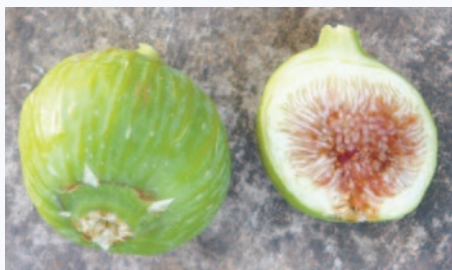
Particolari pomologici del Fico Ficattala (P. Belloni)