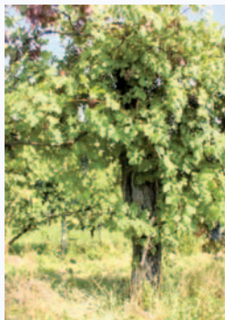
Vite centenaria di Roteglia (S. Guidi)

Non ci sono conoscenze; meriterebbe uno studio del suo DNA per capirne l'esatta origine; l'età secolare che ha raggiunto ci fa capire quanto sia elevata la sua resistenza alle avversità e quindi potrebbe essere impiegato nel miglioramento genetico.