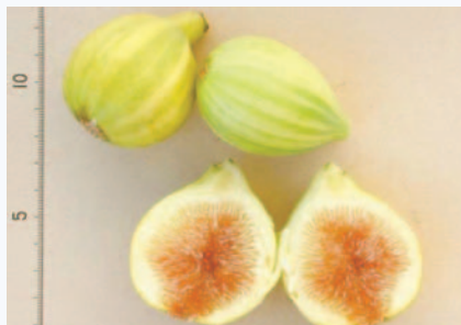
Reperto salentino di Fico Rigato con picciolo corto e di forma subovata (F. Minonne)

Illustrato da Bartolomeo Bimbi (Natura morta, 1696, Palazzo Pitti, Firenze).