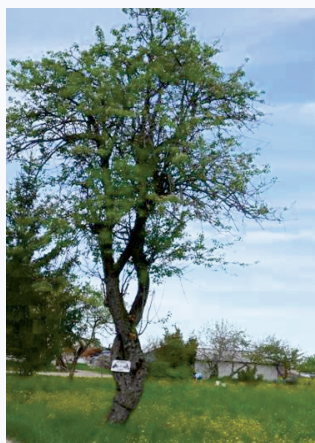
Pianta secolare di Pera delle Garapine (G. Piazzoli)

Di questi frutti si sa poco in quanto sono praticamente sconosciuti come cultivar; essi sono unici per il territorio reggiano e prendono il nome dalla zona chiamata Garapine, situata nella pianura. Il nome sta a indicare antichi prati abbandonati, ormai rari per l'area padana. Secondo alcuni era utilizzato in passato per produrre confetture (i savour in dialetto reggiano).