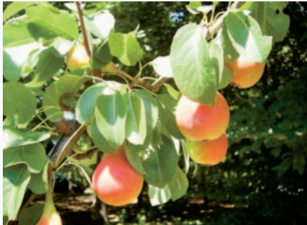
Pere Rampine a maturazione completa (S. Guidi)