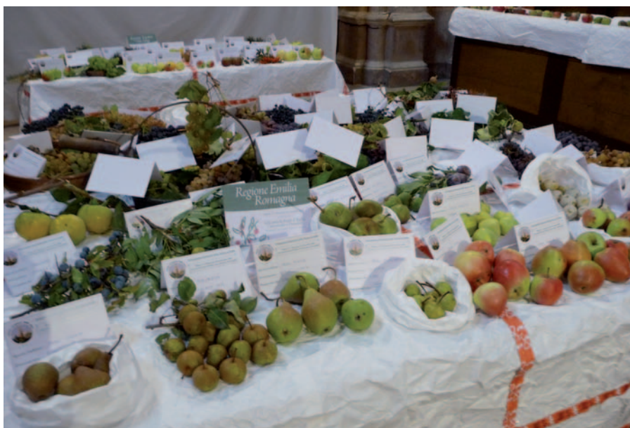
Foto 1: Diversità frutticola delle agricolture promiscue emersa a Pennabilli in occasione della mostra pomologica del 2009

guardia di questo prezioso materiale genetico attraverso mostre mercato. L'ultima iniziativa (settembre 2009) dell'associazione "Patriarchi della Natura" è quella di Pennabilli, in provincia di Rimini, dove è stato possibile raggruppare per la prima volta in Italia, in un unico luogo, i frutti dimenticati a rischio di estinzione e quelli dei più importanti patriarchi fruttiferi. Sono state presentate ben oltre 400 varietà di frutti antichi, semi di cereali e legumi. Per il Mezzogiorno può far testo l'esperienza realizzata in un comune del Brindisino, ove l'"Associazione Pomona" ha realizzato un conservatorio botanico che colleziona diverse decine di varietà di fico.