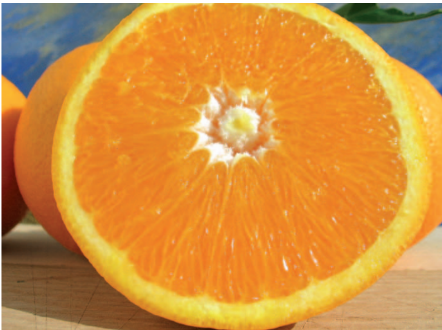
Foto 27: Duretta del Gargano (Biscotti, 2007). Varietà esclusiva degli agrumeti storici del Gargano, inseriti di recente negli agrumeti storici italiani (Senato della Repubblica) e nel catalogo dei paesaggi agrari storici (MiPAAF)

scono giorni di prosperità e di benessere; nonostante la limitata superficie di terreno utile [complessivamente circa 1000 ha] il Gargano si colloca, a livello italiano, al terzo posto per la produzione di agrumi e per le rese unitarie mentre è al primo per i profitti unitari realizzati.