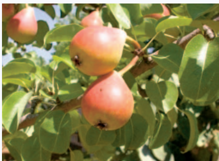
Il Pero Petrucina in fruttificazione (F. Minonne)