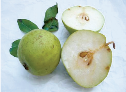
Frutti non ancora completamente maturi (S. Guidi)