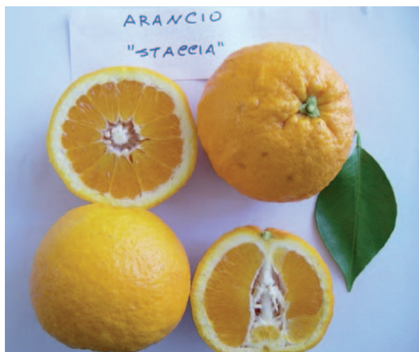
Foto 16: Arancia Staccia [foto in poster Mennone, Calabrone, Milella, Martelli]