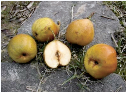
Frutti di Pera Spalèr a maturazione (S. Guidi)