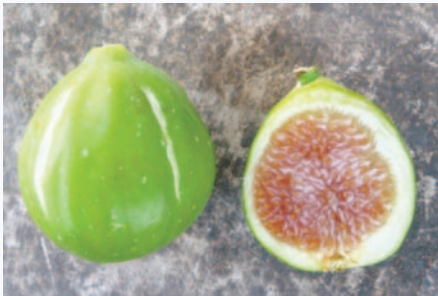
Particolari pomologici del fornito Fasanese (P. Belloni)