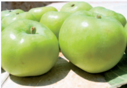
I caratteri peculiari (colore della buccia, forma) della Mela di Maggio (N. Biscotti)