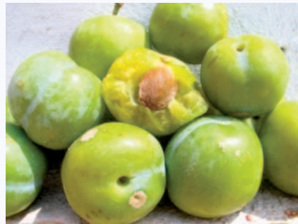
Campioni di Susino Gabbaladro in piena maturazione e con buccia verdastra (N. Biscotti)

Tradizione orale, testimonianze scritte, (Biscotti N., I frutti antichi del Gargano , in corso di stampa). Nessuna attenzione di tutela.