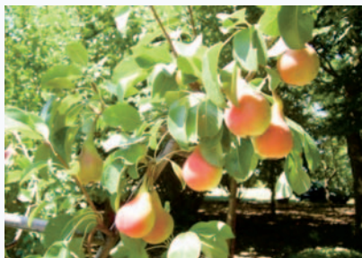
Ramo con Pere Rampine (S. Guidi)

Questo frutto tradizionale della pianura emiliana e romagnola è conosciuto anche come Pera San Pietro e nel dialetto romagnolo viene chiamato anche "Pera Zaclèna". Matura nella prima decade di luglio.