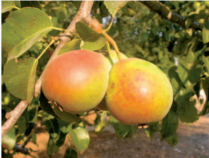
Il Pero Zammarrino in fruttificazione (F. Minonne)