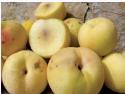
Percoca Bianca in piena maturazione (N. Biscotti)