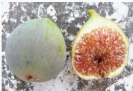
Particolari pomologici del Fico Ricotta (P. Belloni)