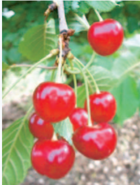
La Ciliegia della Marina in piena maturazione, nella sua forma più tipica (agro di Vico del Gargano (N. Biscotti))