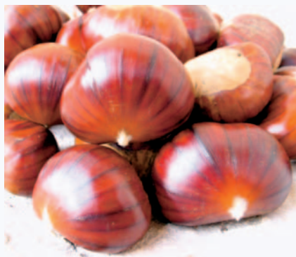
Le caratteristiche striature della Castagna Rigata (N. Biscotti)

Tradizione orale, nessuna attenzione di tutela. Studi in corso (Biscotti, Poster Convegno I Boschi dell'Appennino, Fabriano, 2007; I frutti antichi del Gargano, in corso di stampa).