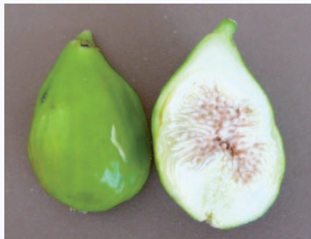
Particolari pomologici del fiorone Fasanese