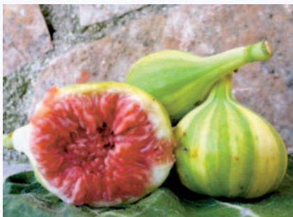
Reperto garganico di Fico Rigato, tendenzialmente piriforme (N. Biscotti)