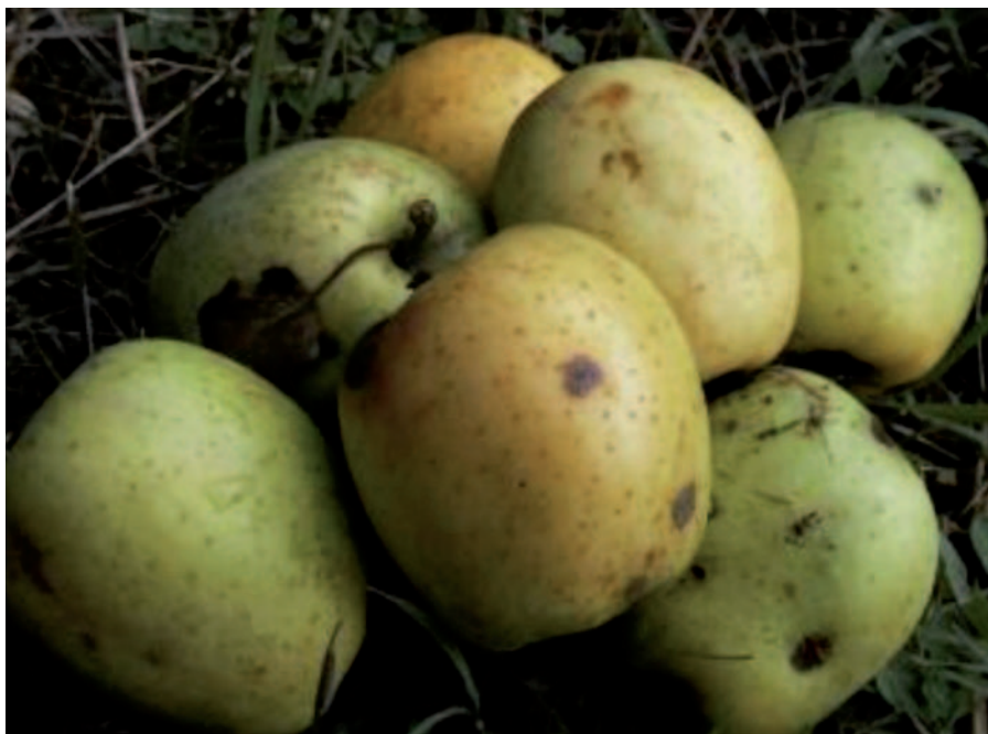
Foto 13: Mele Limoncelle Fotografate da un albero nei pressi di Campobasso