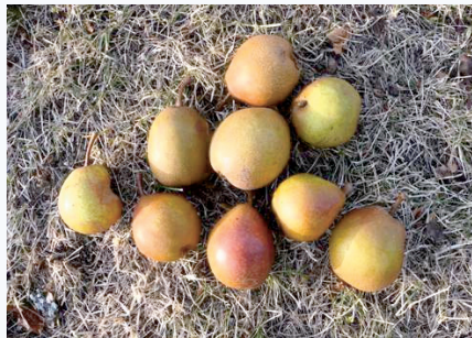
La caratteristica colorazione ruggine dei frutti (S. Guidi)

Non si hanno informazioni a riguardo. Sarebbe interessante approfondire gli studi per capire i motivi di diffusione in un areale così ristretto.