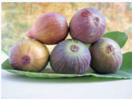
I caratteri peculiari (colore della buccia, forma) del Fico Dottato Nero (N. Biscotti)