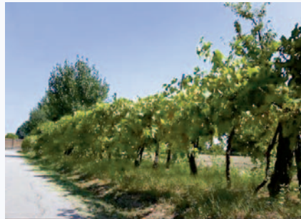
Filare di viti centenarie con l'Uva Morta (S. Guidi)

Questo vitigno era diffuso in passato nella pianura romagnola. Il suo nome deriva dal suo colore che non è né giallo, né rosso, ma marrone, il colore della morte appunto.