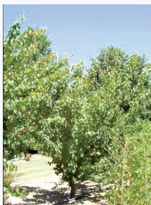
Albero di albicocco in estate (S. Guidi)

In situ: Borgo Tossignano (BO). Si tratta di sole 3-4 piante per cui il rischio di estinzione è tuttora molto elevato. Cultivar a forte rischio di estinzione.