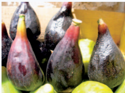
I caratteristici picciolo allungati e legno dei piccioli del Fiorone Menna di Vacca (N. Biscotti)

Tradizione orale, testimonianze scritte (Biscotti N., I frutti antichi del Gargano , in corso di stampa) nessun progetto di tutela e valorizzazione