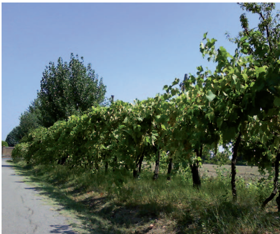
Foto 24: Pergola romagnola di viti centenarie salvate, fra cui l'Uva Morta e la Caveccia (S. Guidi)