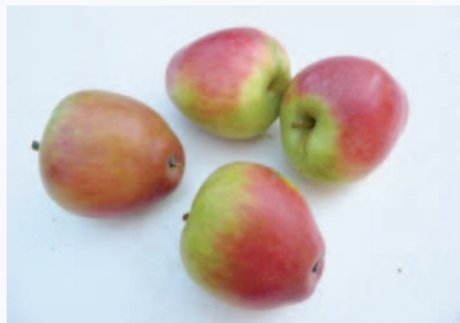
Frutti in fase di conservazione avanzata (S. Guidi)

Cultivar che andrebbe conservata per il suo germoplasma ma dato l'aspetto curioso dei frutti, potrebbe avere buone possibilità di mercato come prodotto locale, biologico.