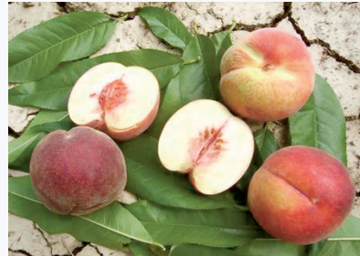
Caratteristica polpa bianca della Bella di Cesena (S. Guidi)

Questo frutto era diffuso in passato in Romagna, ma visto che non si prestava alla commercializzazione per la sua delicatezza è stato abbandonato. Oggi restano alberi sparsi vicino alle case coloniche coltivati a scopo amatoriale e per il consumo dell'agricoltore.