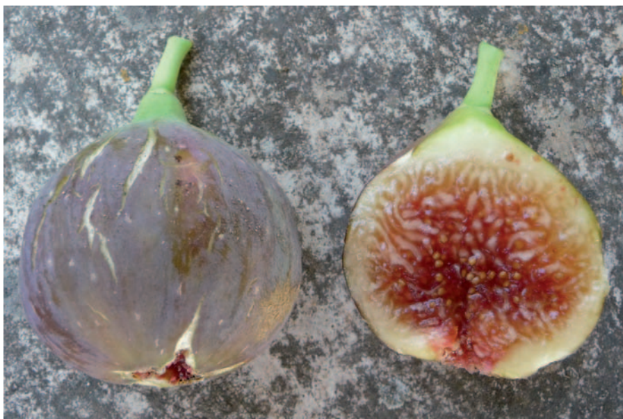
Foto 28: Fico Mattepinta o Tremona del brindisino dal Conservatorio botanico di Cisternino (Paolo Belloni)