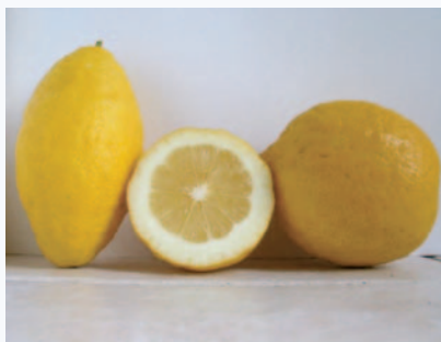
Caratteri morfologici del frutto da ellissoidale a globoso (N. Biscotti)

Studi e ricerche inedite (Biscotti) in corso di pubblicazione (Claudio Grenzi editore, Foggia).