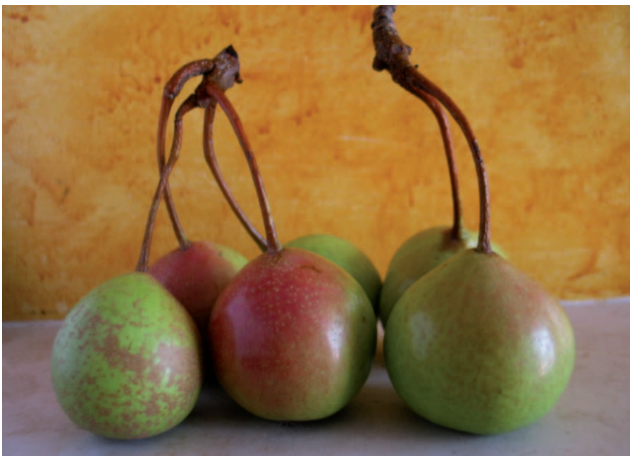
Foto 30: Pera Mezzorotolo (a forma di ruota), nel Gargano, destinato all'essiccazione (N. Biscotti)

zata non solo sui mercati locali ma anche su taluni nazionali”, fanno ormai storia. Oggi ci sono ancora i vecchi alberi, ma da tempo, per queste peraglie, non v'è più mercato se non per qualcuna (Pera d'Ischitella) e solo a livello di mercati comunali. La presenza di numerosi alberi attesta la particolare diffusione che questa specie ha avuto nel Gargano. Ogni perastro ( Pyrus amygdaliformis ) è diventato, con l'innesto, un pero, uno per ogni tempo, uno per ogni luogo, da quello dei tratturi a quello di solitarie masserie, a quello che sbuca in mezzo al campo di grano, ancora più prezioso perché, oltre al frutto, determina ombra e frescura per le brevi pause del mietitore (Pero Pagghjionica). Il ruolo del frutto non si esauriva nei soli mesi estivi: tante varietà erano destinate all'essiccazione per poi essere passate al forno in modo da ottenere scorte di zuccheri (pere infornate) durante i lunghi inverni.