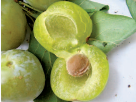
La caratteristica polpa completamente spicagnola del Susino Gabbaladro (N. Biscotti)