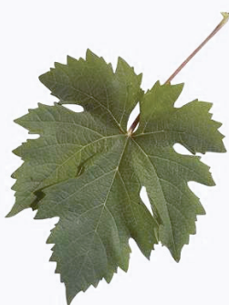
Foglia di Uva Verdetto (S. Romani)

Viene ricordato da De Bosis F. nei Bollettini Ampelografici del 1879 fra le uve bianche del circondario di Rimini. Sembra essere un vitigno tipicamente riminese, non presente nel forlivese e cesenate. Gli anziani viticoltori ricordano che il Verdetto, per il suo colore verdognolo anche a maturazione, veniva piantato nei filari più lontani da casa in quanto, per questa sua caratteristica, non veniva rubato all'epoca della vendemmia in quanto ritenuto immaturo.