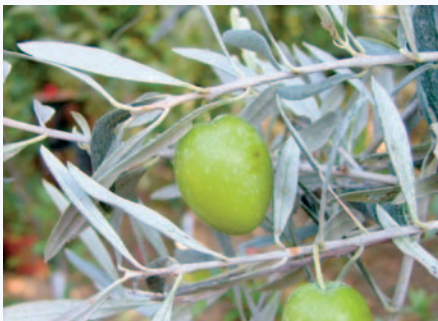
Olive dell'esemplare ultracentenario di Tabiano (M. Carboni)