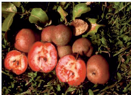
Pera Cocomerina tardiva a completa maturazione (S. Guidi)