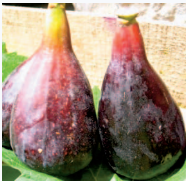
La particolare forma del Fiorone Menna di vacca (N. Biscotti)