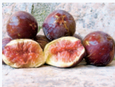
Caratteri della polpa del Fico Dottato Nero (N.Biscotti)

Scoperto nel 2005 casualmente un vecchio albero, poi morto (Biscotti) lungo il letto di un torrente. Urgono ricerche di campo, per verificare l'esistenza di altri alberi e porne studiare in maniera adeguata tutti gli aspetti pomologici ed agronomici