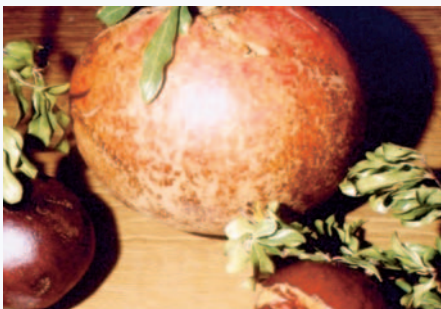
Confronto delle dimensioni con altra varietà (S. Guidi)