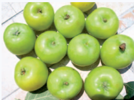
Visione d'insieme della Mela di Maggio (N. Biscotti)

Di varietà a buccia "verde" n'esistono oggi appena 37 delle circa 600 che sono segnalate nell'Elenco delle cultivar autoctone italiane (CNR, BALDINI et alii, 1994). sono piemontesi, del Trentino Alto Adige, Emiliane. nessuna invece dell'Italia Centro-meridionale. Per la mela di Maggio del Gargano, nessuna attenzione di tutela.