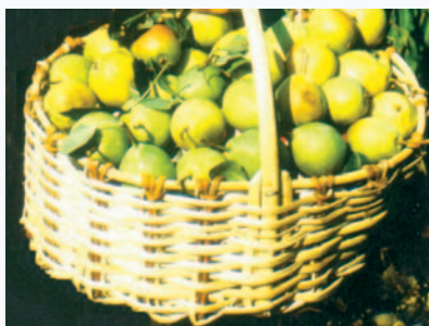
Pera Cocomerina precoce a maturazione (S. Guidi)

In situ: aziende agricole di Verghereto e Bagno di Romagna, Ex situ: giardino della biodiversità di Cesenatico.