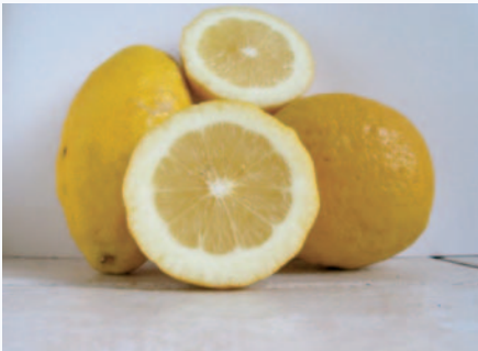
I caratteri peculiari (colore del flavedo e dell'albedo, forma) della Limoncella (N. Biscotti)