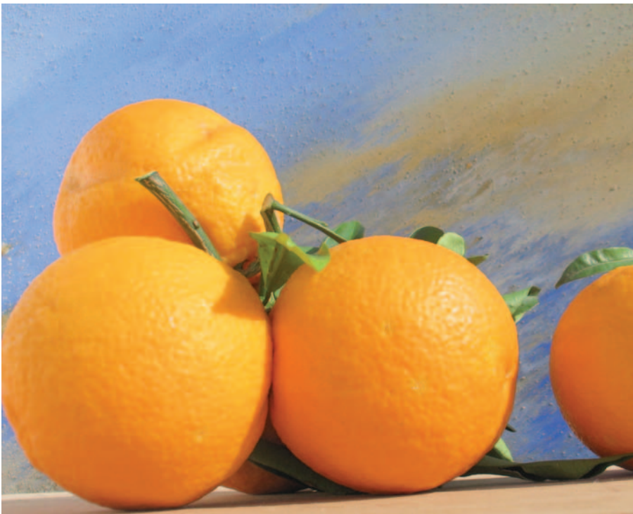
Foto 17: Arancia Squacciata , ecotipo garganico di Biondo Comune (N. Biscotti)