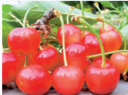
Campioni di Ciliegia della Marina raccolti nel territorio di Carpino (N. Biscotti)

Tradizione orale. Nessuna attenzione di tutela.