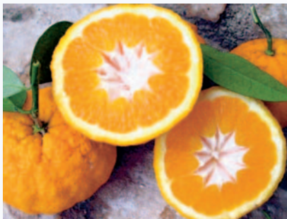
Sezioni trasversali di Arancia Incannellata che evidenzia la colonna carpellare cava e con caratteristico disegno (N. Biscotti)

Tradizione orale attesta un antico legame con gli agrumeti garganici (Biscotti N., I frutti antichi del Gargano , in corso di stampa). Con ogni probabilità sul piano varietale è da attribuire all' Arancia Incannellata , antica varietà di arancio amaro ( Citrus Aurantium Caniculata ) descritto già da Gallesio. Un arancio "Incannellato" si trova nella Limonaia dei Giardini dei Boboli a Firenze. Esistono anche limoni o limoncelle incannellate: ne parla nel 1500 il botanico Della Porta per Sorrento e come tale, Limonier à Fruit Cannelé, sono classificate da Antoine Risso (1818).