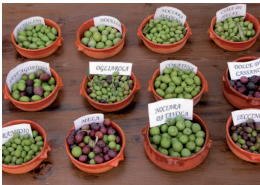
Foto 26: Diversità di olive (Frantoio, Nocella, Nociara, Leccino, Oggiarola, Dolce di Cassano, Mela) nel brindisino (Masseria "Il Frantoio", Ostuni).

sono state invece gradualmente sostituite dalle cosiddette nuove varietà. In entrambi i casi si è assistito al progressivo impoverimento intraspecifico del patrimonio varietale tradizionale che si è prodotto in ogni contesto agricolo, dal Gargano al Salento. Quanto ampia sia la diversità persa non è dato sapere con numeri attendibili e anche la stessa documentazione bibliografica è settoriale e limitata per quanto preziosa. In bibliografia si trovano diversi autori ma le loro testimonianze sono relative ad alcune aree o solo per alcune colture. Si hanno lavori datati e generali per il mandorlo (Pantanelli, 1936), per la vite (Froio, 1875); altri, invece, sono relativi ad alcune specie e a precisi distretti agricoli, come il Salento (Minonne et al., 2002).