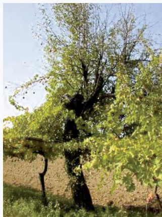
Il pero come tutore vivo nei filari di viti (S. Guidi)

Sergio Guidi Arpa FC (sguidi@arpa.emr.it)