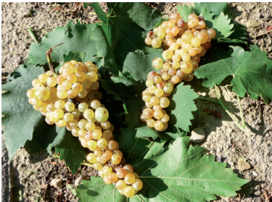
Foto 18: Grappoli con foglie del vitigno Corinto in rinvenuto a Belpasso (CT)