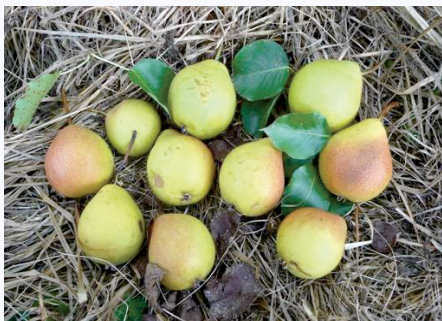
Pere Ravignane a maturazione completa (S. Guidi)