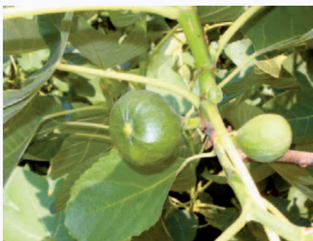
Frutto immaturo del Fico di Cavana (S. Guidi)