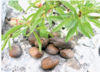
Particolari di foglie, frutticini e frutti stramaturi di Prunus webbii Spach. (N. Biscotti)

Tradizione orale, testimonianze scritte (Nuovi rinvenimenti di Prunus webbii (Spach) vierh. In Puglia di Piero Medagli et alii, 2004, Dipartimento di Scienze e Tecnologie Biologiche e Ambientali Università di Lecce; ; Botanica del Gargano, di Biscotti N., 2002, Gerni editori, San Severo (FG).