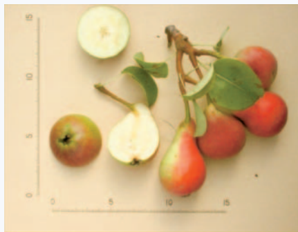
Particolari pomoloci della Pera Petrucina (F. Minonne)

Tradizione orale e documentazione storica; rilievi ed osservazioni pomologiche sono state fatte nell'ambito di una tesi di Dottorato (Minonne, 2008). Non è riportata dagli autori pugliesi che si sono occupati di questa specie Donno (1959), Reina (1974), Ferrara (1970); potrebbe essere "nascosta" sotto qualche sinonimia. Progetti di valorizzazione in atto in alcune aziende ortofrutticole del territorio leccese.