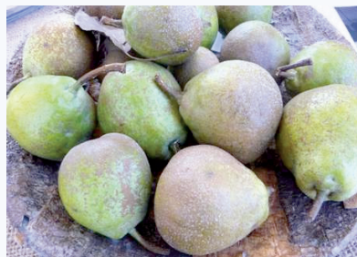
Frutti raccolti a fine ottobre nella zona di Scurano (S. Guidi)

Questo frutto sembra essere unico per il territorio collinare permense, veniva in passato coltivato per l'autoconsumo.