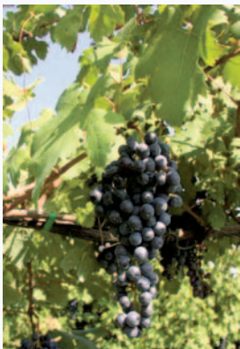
Grappoli di uva della Vite di Roteglia (S. Guidi)