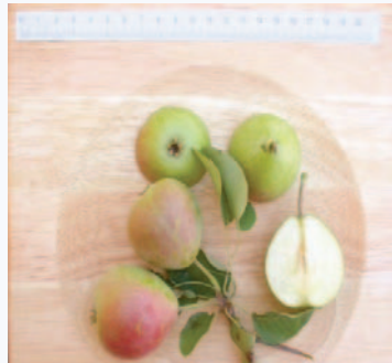
Particolari pomologici della Pera Zammarrino (F. Minonne)

Tradizione orale. Rilievi ed osservazioni pomologiche sono state fatte nell'ambito di una tesi di Dottorato (Minonne, 2008). Non è riportata dagli autori pugliesi che si sono occupati di questa specie (Donno 1959; Reina 1974; Ferrara 1970).