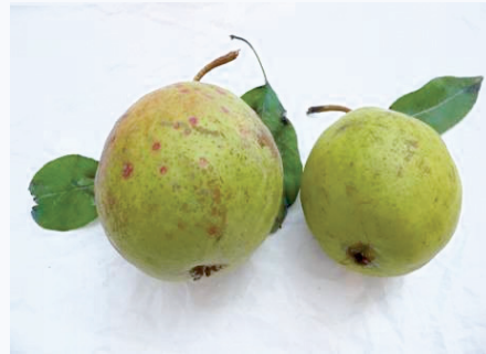
Frutti di pero limone appena raccolti in settembre (S. Guidi)

Tradizione orale, al momento nessuna attenzione e tutela.