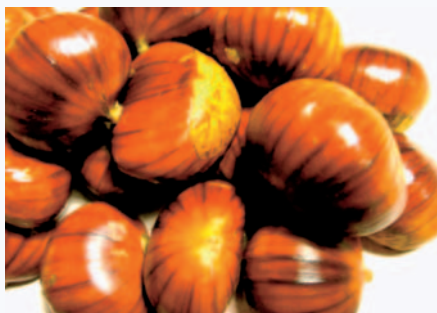
Campioni della Castagna Rigata (N. Biscotti)