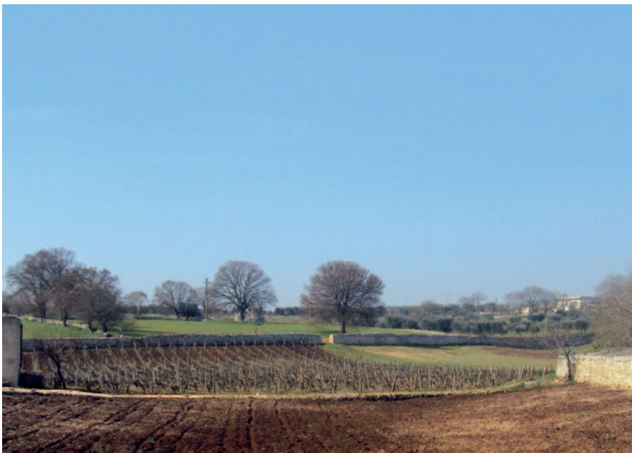
Foto 29: Vigna del Brindisino (Cisternino) allevata ad alberello (N. Biscotti)

Di questi eventi rimangono oggi testimonianze di piccole vigne, sopravvissute all'abbandono diffuso della viticoltura garganica, mantenute in vita ancora per poco da anziani contadini. Sono stati censiti 58 vitigni (Biscotti, in corso di stampa), distinti per caratteri ampelografici e colturali. Non vi era un vino, ma i vini del Gargano: di Vieste, Vico, Ischitella, Monte S. Angelo, Sannicandro, San Giovanni Rotondo. Doveva trattarsi di autentica identità, se si tiene conto del fatto che ogni agro, ogni paese aveva più o meno il suo vitigno: Uva da Macchia, Puducin Tener, Barbaroscia, Bell'Italia, Uva Sagra, Zagarese (Vico del Gargano), Pagghjione, Nereto, Lunardbèll (Monte S. Angelo), Cassano Nero, Rausano (San Giovanni Rotondo), Plaus, Cestoneja, Uva di Vespa, Uva degli Sciali (Vieste), Virr'cùn (San Marco in Lamis), Moscato Garganico (Vico, Vieste, Peschici), Plavca, Nereto (Peschici); Uva a Nocella, Uva Sant'Anna Bianca e Nera (Ischitella). A tutt'oggi non è stata presa nessuna iniziativa in merito per cui è concreto il rischio di erosione genetica.