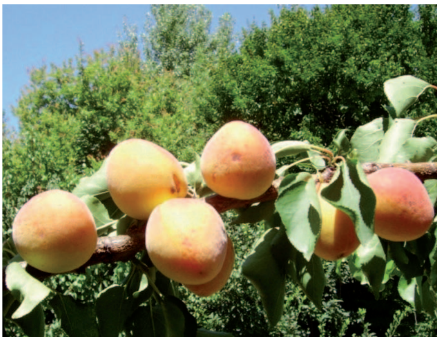
Foto 23: L'albicocco, frutto caratteristico della Romagna (S. Guidi)

L'albicocca è un frutto che arriva dalla lontana Cina, in cui era conosciuta già quattromila anni fa. Attraverso il Medio Oriente giunse fino al bacino del Mediterraneo. In Emilia-Romagna l'area interessata alla produzione comprende il comprensorio imolese e la Valle del Santerno e copre una superficie di circa 1390 ettari, per una produzione che si aggira sulle 16.000 tonnellate annue. L'albicocca Val Santerno d'Imola si coltiva dal fondovalle a un'altitudine di circa 350 m s.l.m. A testimonianza di quanto sia radicata questa coltura in Romagna, si ricorda che il primo impianto intensivo risale al 1870 e si trovava nel podere Vallette di Pieve Sant'Andrea, nel comune di Casalfiumanese. Dal punto di vista climatico, tale zona presenta condizioni ottimali nelle fasi critiche di crescita e maturazione del frutto: le estati sono calde e gli inverni rigidi, le precipitazioni sono prevalenti in autunno e minime in estate. La scarsa presenza di gelate primaverili tardive permette di evitare danni ai fiori o ai frutti.