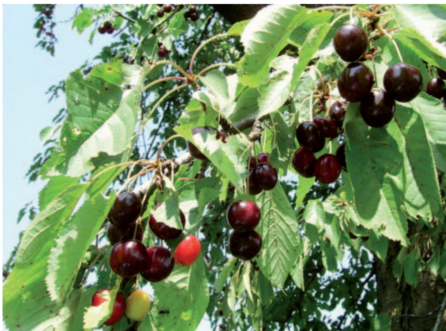
Foto 22: La ciliegia Morettina di Vignola in piena maturazione (S. Guidi)