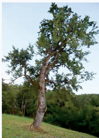
Pero Ravignano secolare (S. Guidi)

Questo frutto unico per il territorio modenese, veniva in passato coltivato per l'autoconsumo e destinato alla produzione di ottime confetture che si consumavano durante tutto l'inverno. I peri isolati in mezzo ai campi avevano anche la funzione di offrire l'ombra sotto la quale consumare la colazione durante i lavori estivi di mietitura e fienagione.