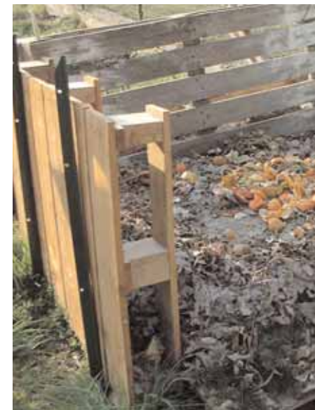
archivio E.R.I.C.A. 2006