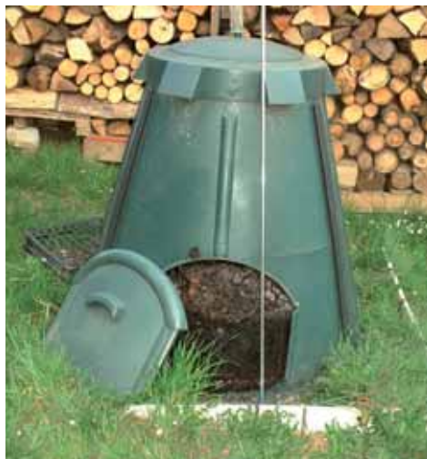
archivio E.R.I.C.A. 2005

D'altra parte molte città o regioni hanno già messo in campo azioni di prevenzione, mentre altre sono praticamente al punto zero.